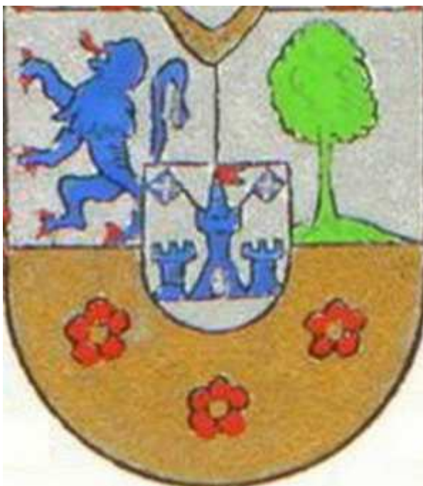
Le blason de la famille de SAROLEA. (Voir description en première page).

En 1694, à la mort de l'abbé Guillaume de Xhénemont, Dom Robert, lors des élections pour nommer un nouvel abbé, obtint le plus grand nombre de voix. Mais, comme des dissensions séparaient les religieux du Val-Dieu, les commissaires royaux préférèrent élever un moine de Villers à la dignité abbatiale, malgré les démarches du seigneur de Cheratte, père de Dom Robert 85 . Ce dernier mourut en 1696.