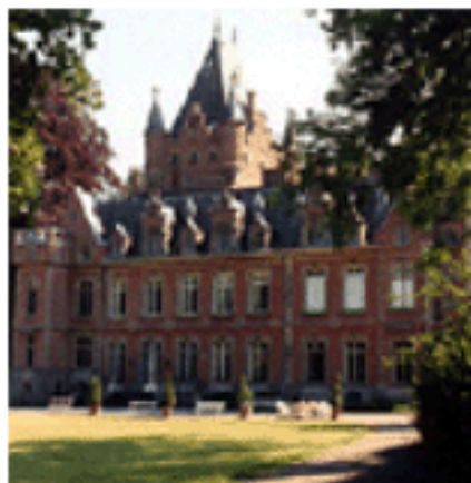
Le château de Louvignies, rue de Villegas 1 à 7063 Louvignies (Soignies)

Rentier vivant à Louvignies (1801-1855), époux de la baronne Caroline de Woelmont (1807-1843), trois enfants : Léon (1840-1917), Marie (1842-1918) et Philippine (1843-1921). Lors de l'élaboration du plan, les parents décédés, les enfants devenaient propriétaires via la succession. La matrice cadastrale domicilie à tort le propriétaire à Louvegnée, alors qu'il demeurait à Louvignies, près de Soignies. Une rue y porte par ailleurs son patronyme.