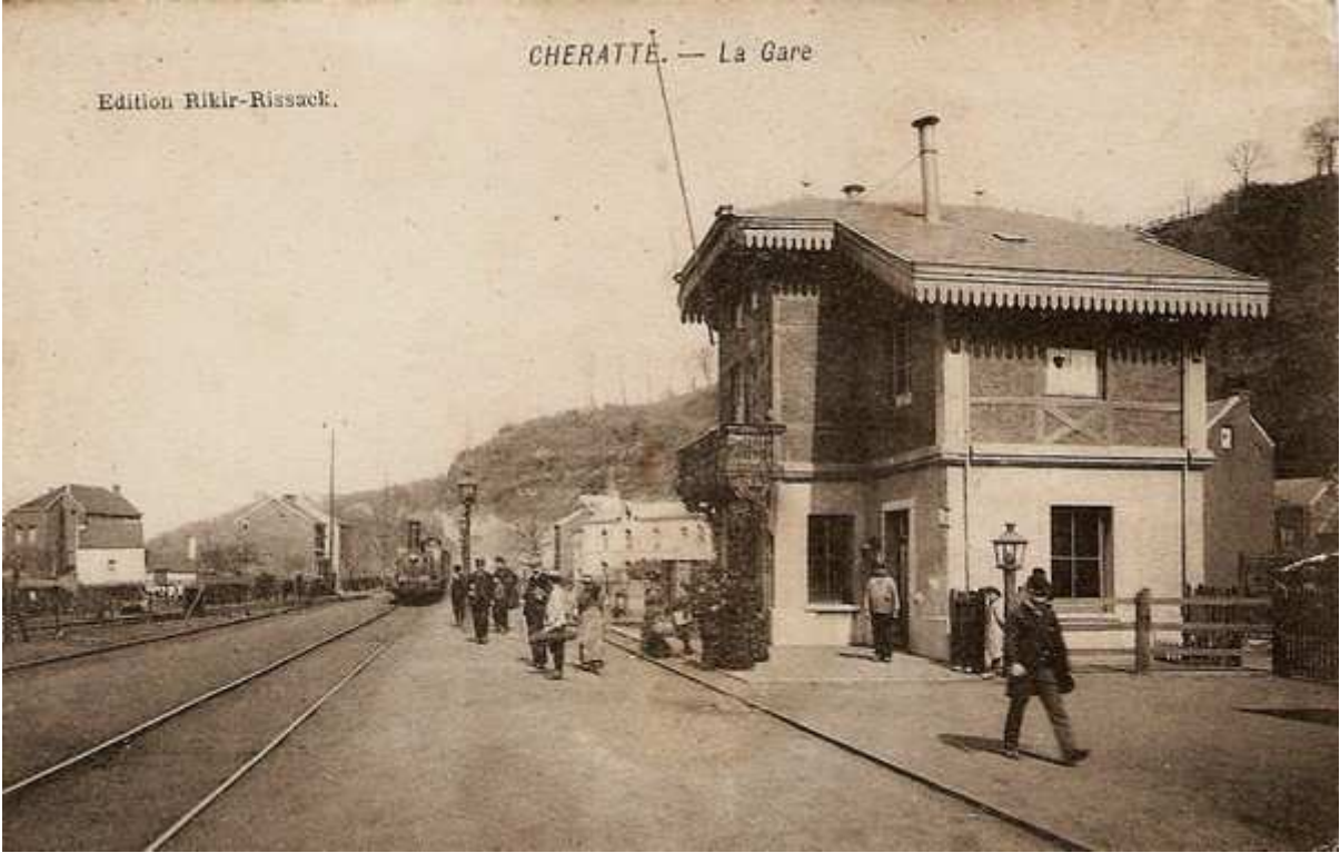
La gare en activité vers 1920