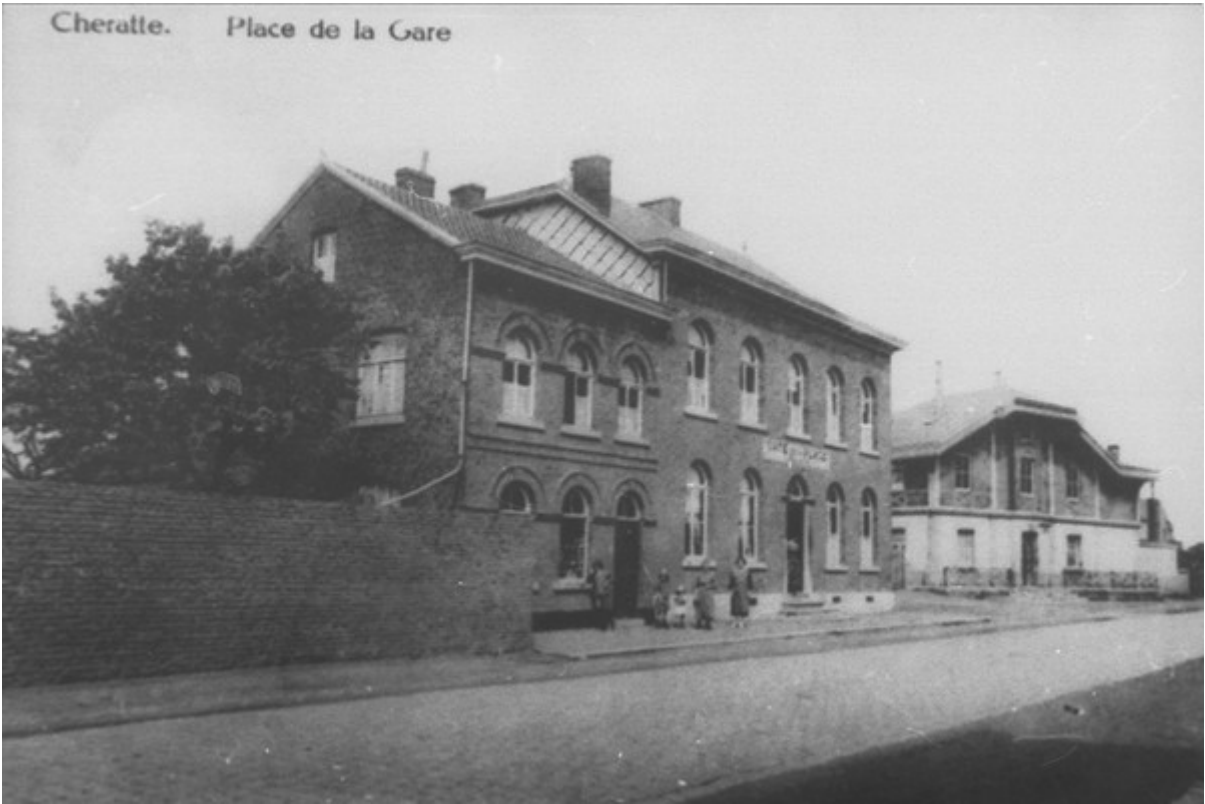
Le café de la place en 1926 avec, à l'époque, son entrée au milieu de la façade