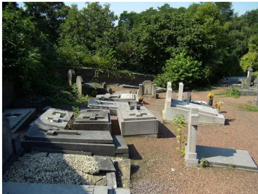
Le cimetière « protestant » : au fond, au milieu, la tombe del Campo