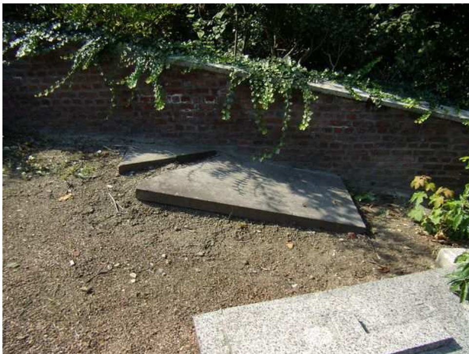
La tombe del Campo est brisée