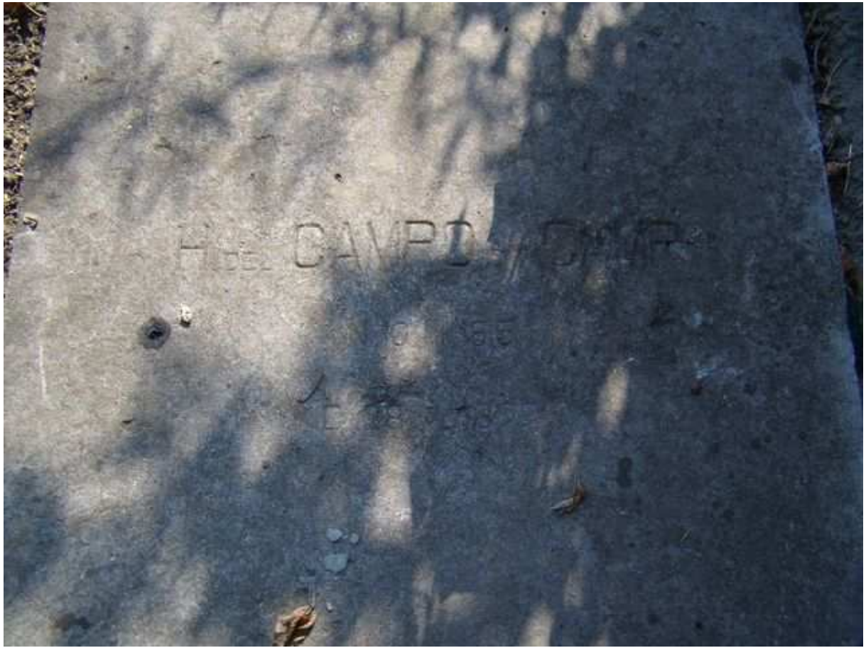
Détail de la tombe du colonel Henri del Campo dit Campo