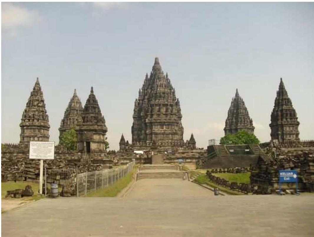
Temple de Trabanan à Java