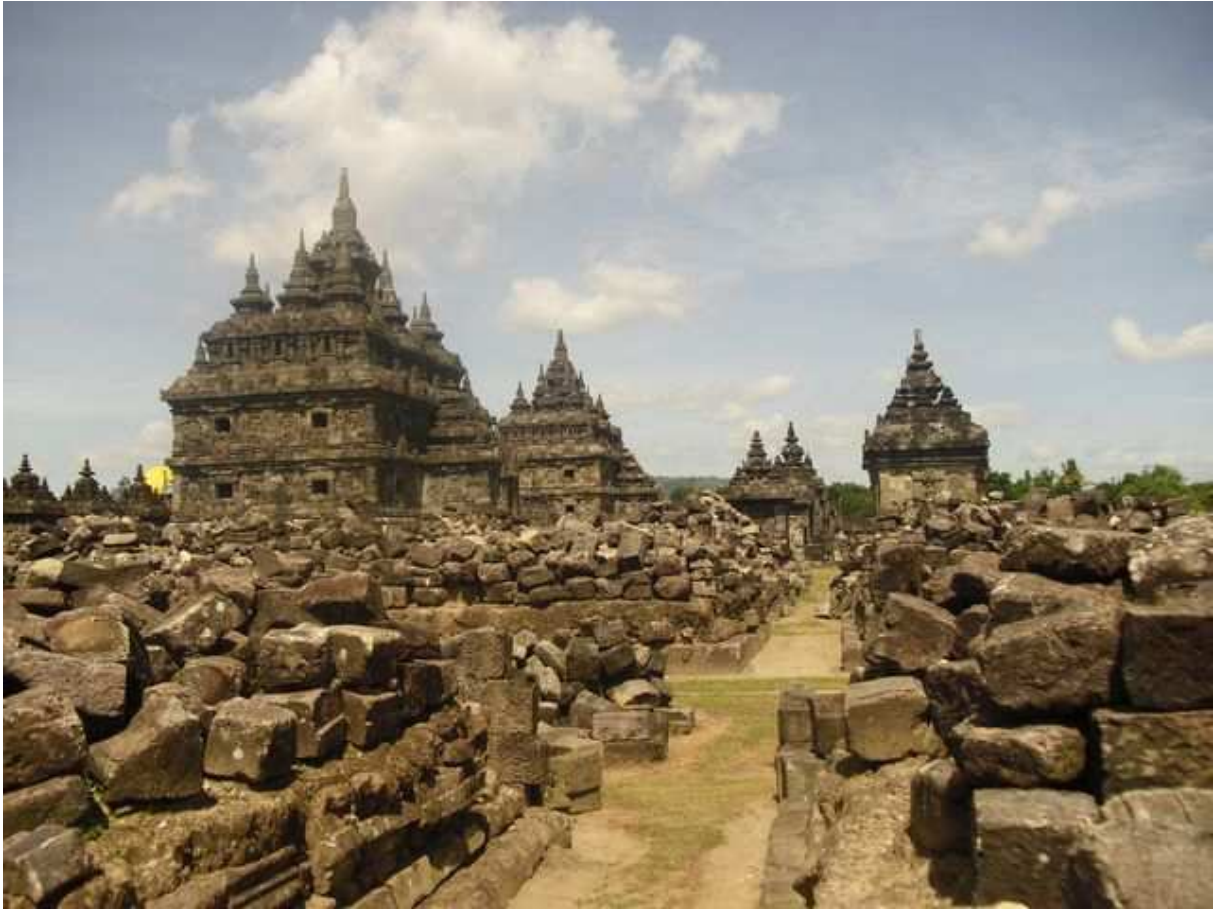
Temple indonésien Java