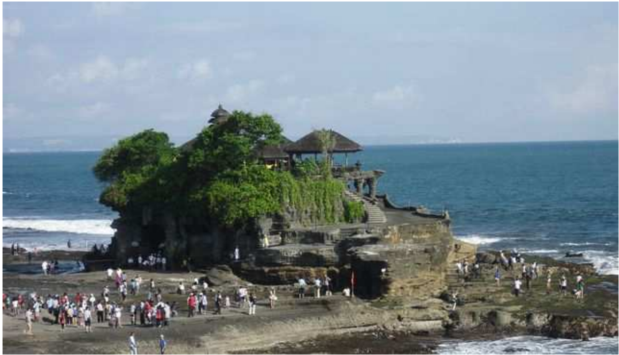
Temple indonésien à Bali