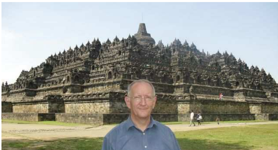
Temple de Borubodur à Yogyakarta Java