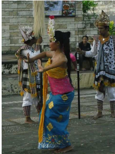
Costumes traditionnels indonésiens