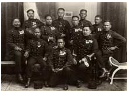
Soldats Javanais en Indes néerlandaises en 1927