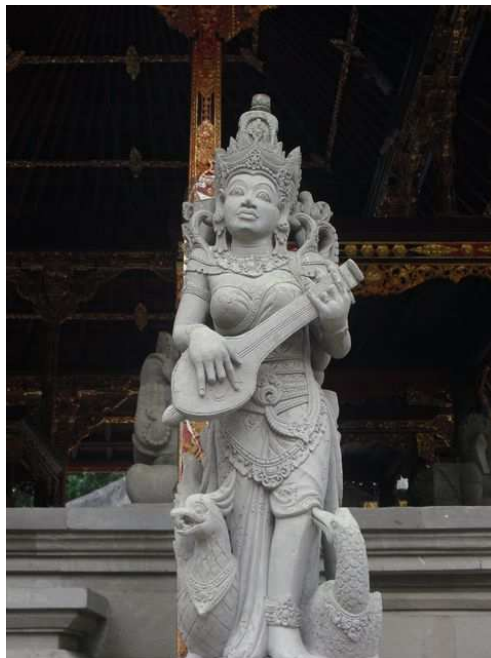
Déesse indonésienne Saraswati