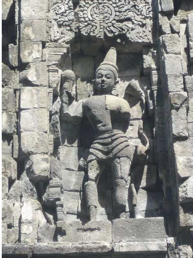
Déesse indonésienne à Java