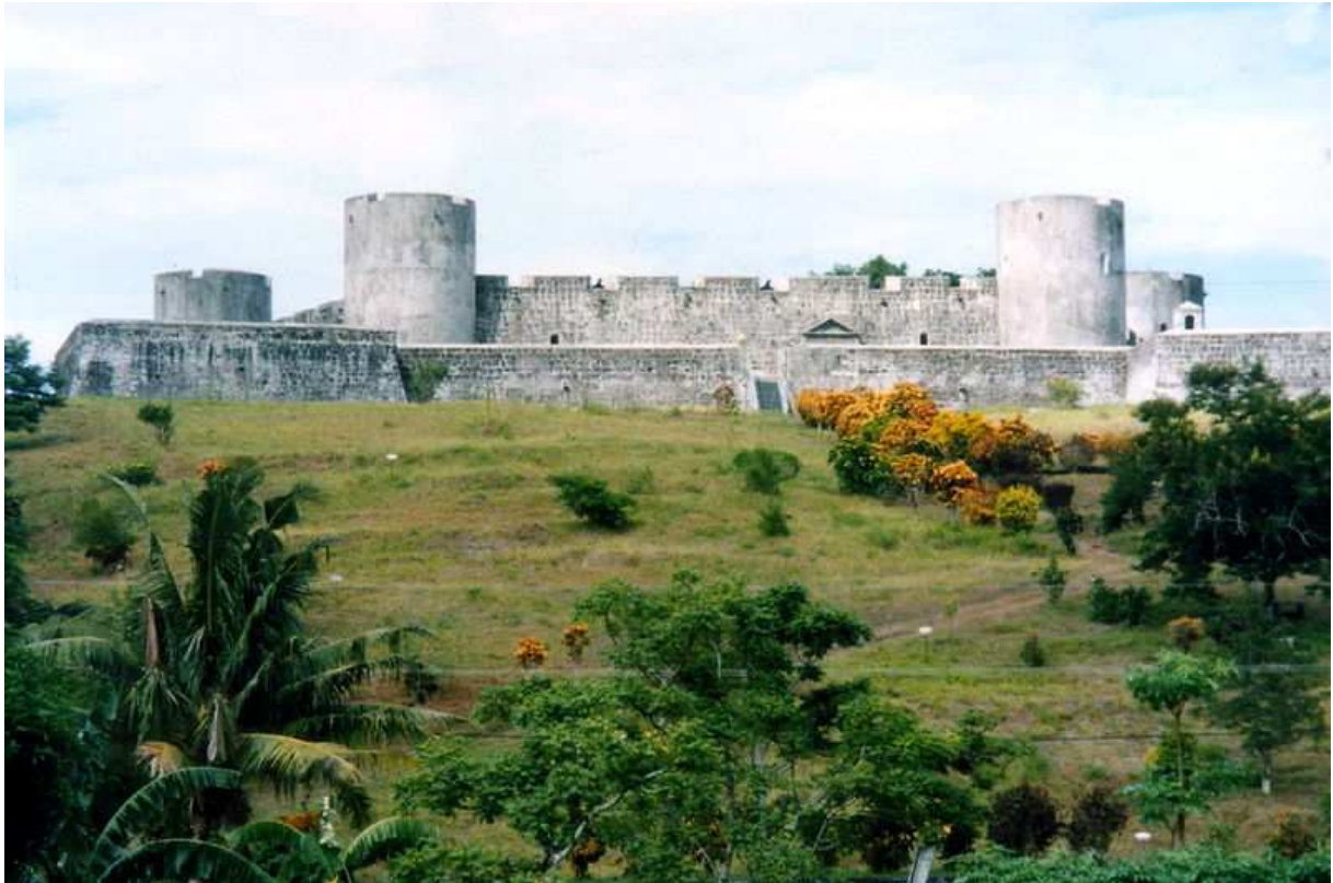
Fort Belgica aux Indes néerlandaises