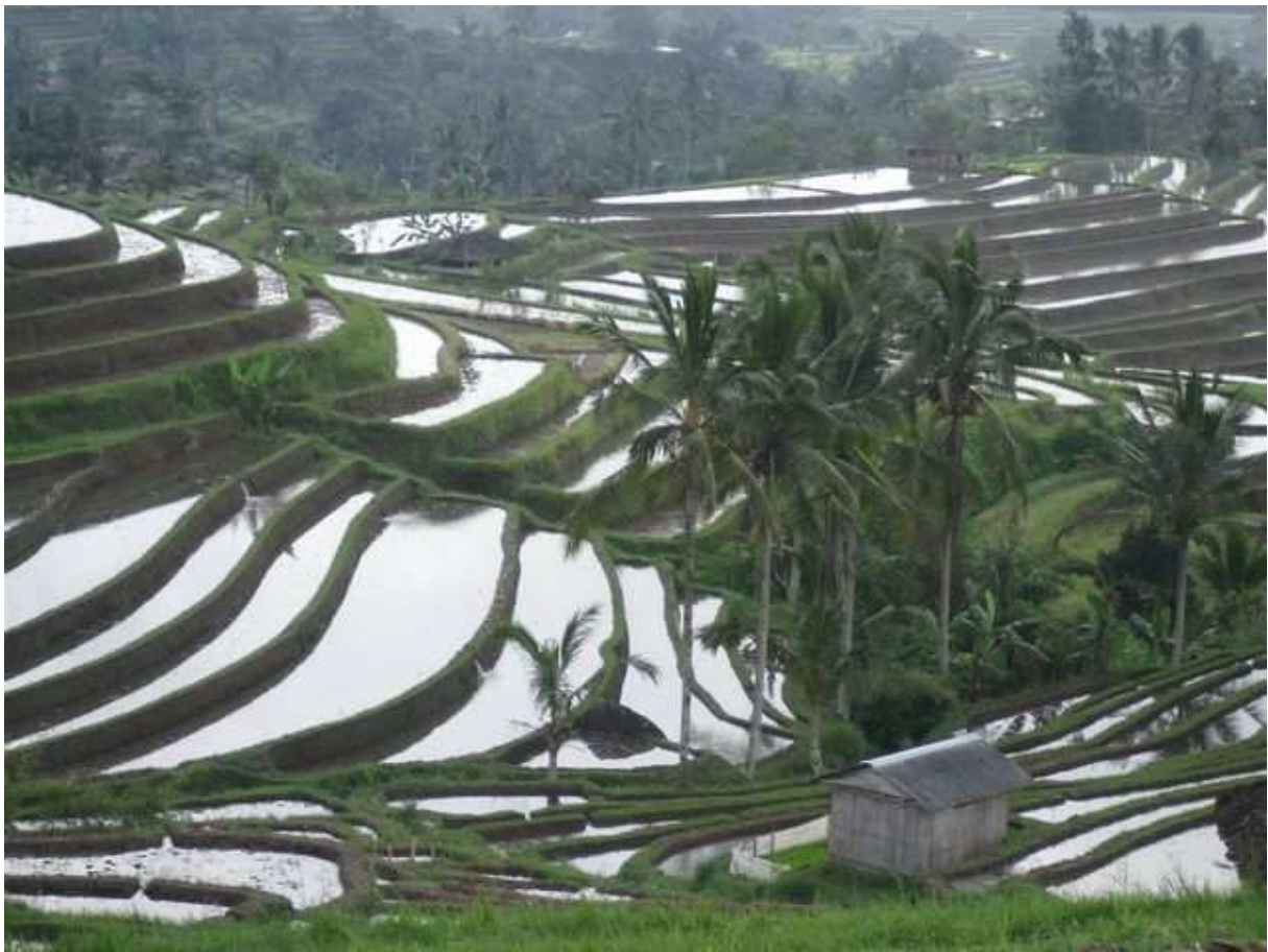
Les cultures de rizières en Indonésie

Les Indes néerlandaises sont une vaste colonie pour nos voisins du nord. Ceux-ci, comme c'est d'usage à cette époque, vont s'efforcer d'en retirer toute la richesse qu'ils peuvent, en exploitant le sol, le sous-sol, bref le maximum de ressources que le pays colonisé peut apporter à la richesse du pays colonisateur. Aujourd'hui, avec notre mentalité actuelle, nous jugeons cela peu équitable pour les populations autochtones, mais, à l'époque, tous les pays « riches » faisaient de même. La Belgique, au Congo, n'a pas dérogé à cette règle !