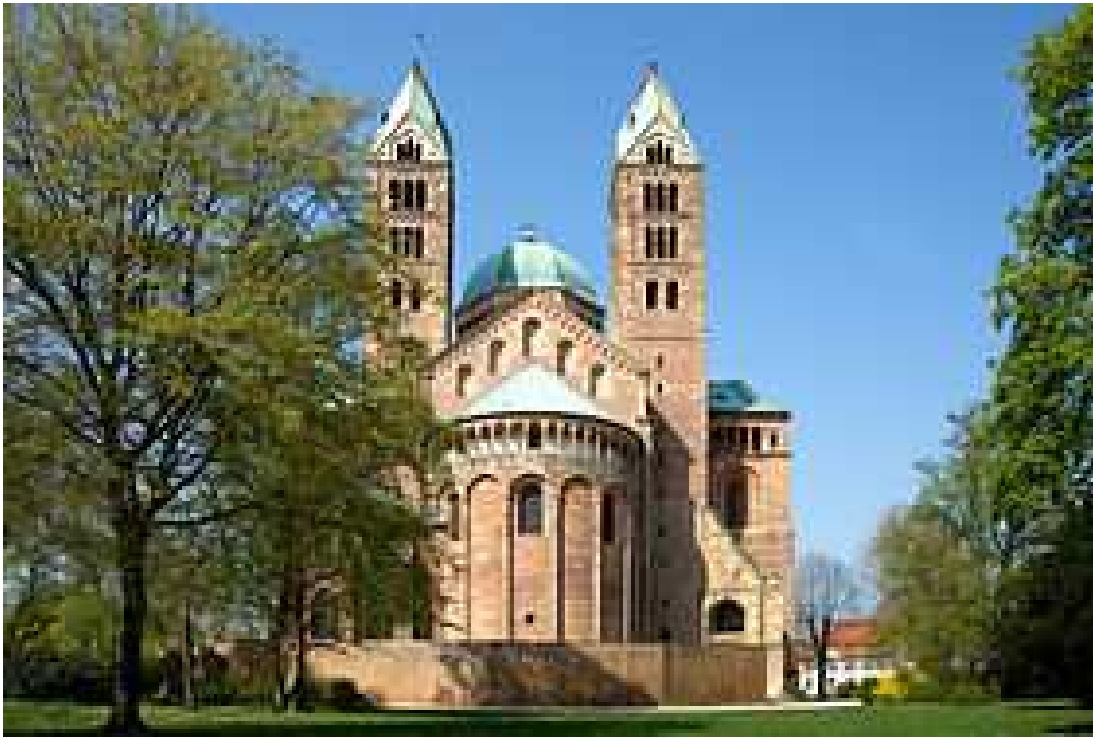
Cathédrale de Speyre restaurée